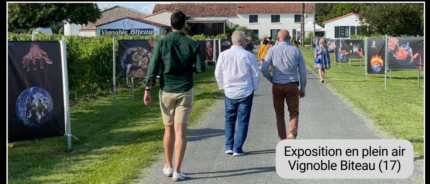
Exposition en plein air Vignoble Biteau (17)