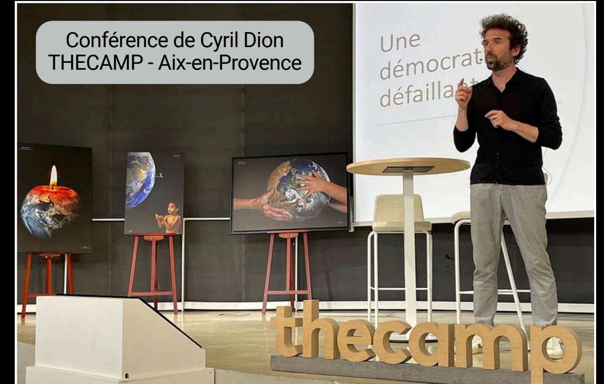
Conférence de Cyril Dion THECAMP - Aix-en-Provence