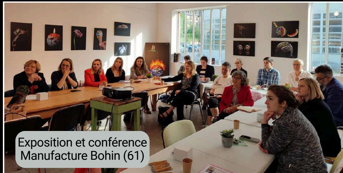
Exposition et conférence Manufacture Bohin (61)