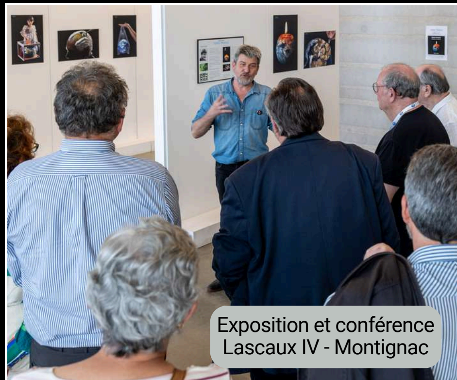
Exposition et conférence Lascaux IV - Montignac