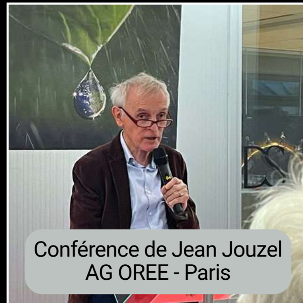
Conférence de Jean Jouzel AG OREE - Paris