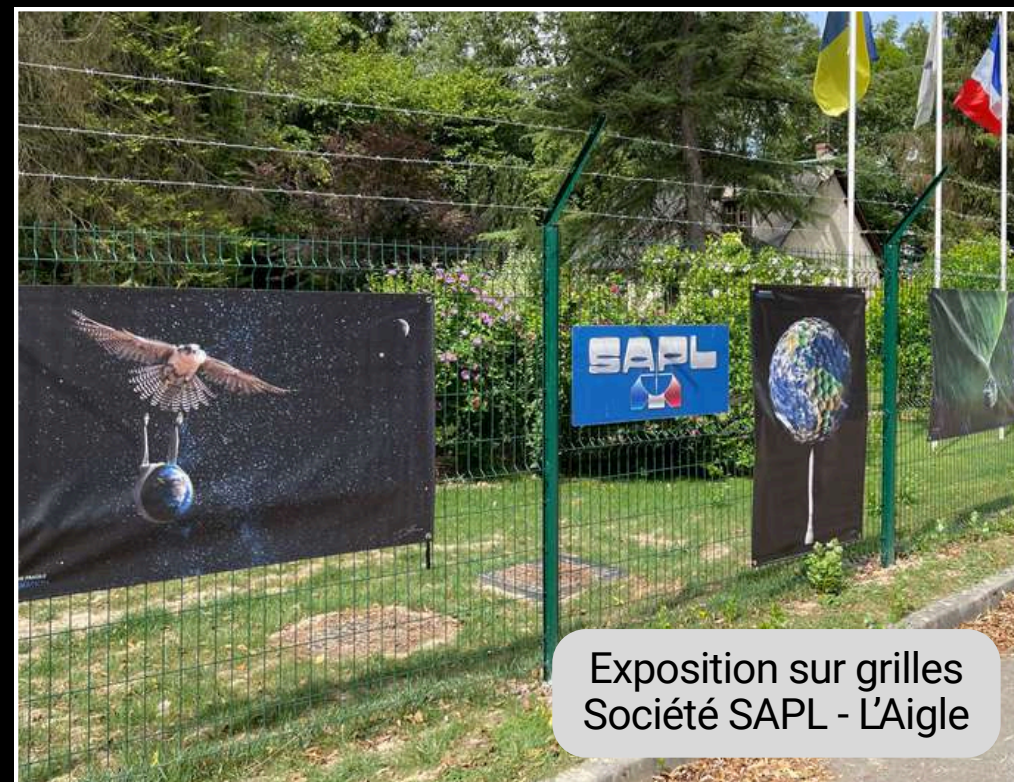
Exposition sur grilles Société SAPL - L'Aigle